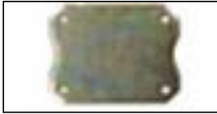
BK0050-00 COPERCHIO PLD