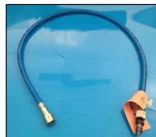
AAT600-FX TUBO BLU ALTA PRESSIONE PER BANCHI DELPHI/HARTRIDGE