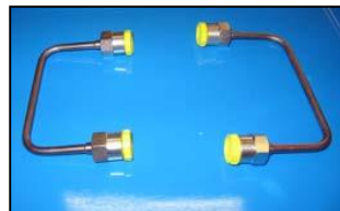
AAT201-AVM COPPIA DI TUBI PIEGATI X AVM DELPHI