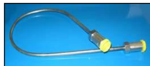
AAT120-BH 1.680.750.120 High pressure