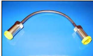
AAT105-BH 1.680.750.105 High pressure