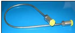
AAT110-BH 1.680.750.110 High pressure