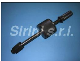
AE0226-00 ESTRATTORE A COLPI UNIVERSALE