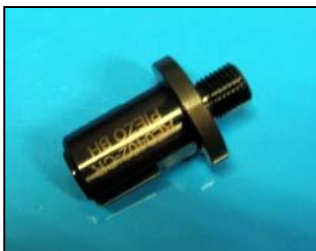
AE0402-CR ESTRATTORE INIETTORI BOSCH PIEZO